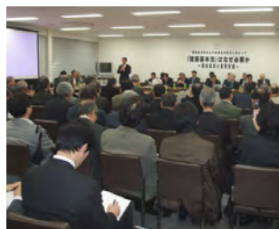
議員会館シンポジウムのようす (2009. 11. 17)