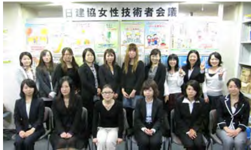
(上) 第1回女性技術者会議参加者。当日は東洋大学の学生2名も参加。(2010.11.26 於：日建協本部)