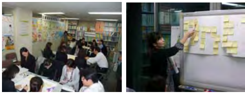
(左下) グループ討議の様子。3つのグループに分かれて意見やアイデアを抽出。